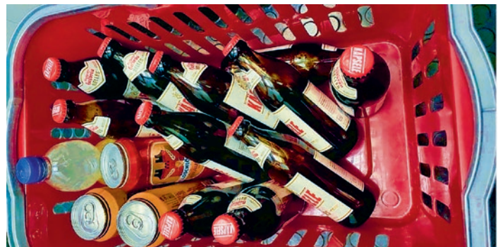
... sowie «isotonische Durstlöcher» der letzten Trainingseinheit in der Halle (Februar 2022).