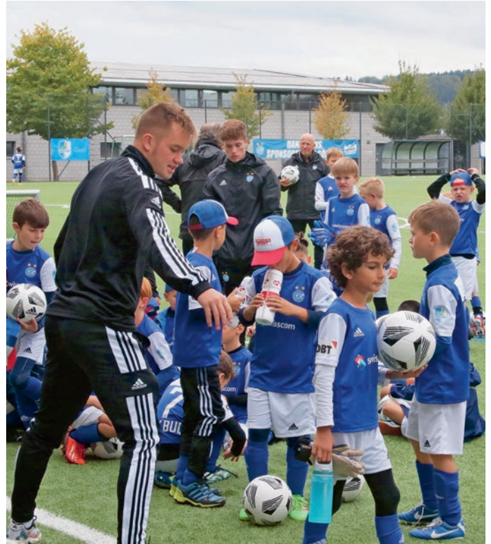
Zuletzt lief das Camp in Zusammenarbeit mit den Grasshoppers. Dieses Jahr macht sich der FC Wohlen diesbezüglich selbstständig.