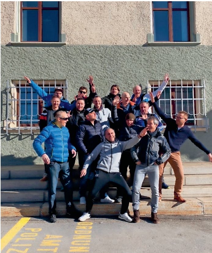
Gruppenbild vom letzten Höhentrainingslager März 2020 sowie den ersten ...

Wie schon des Öfteren berichtet, scheinen sich unsere Gegner stets zu verjüngen, was uns meist nicht so gut gelingt. Zwar dürfen wir diese Saison auch wieder neue Gesichter im Team begrüßen, der sogenannte Stamm der Mannschaft bewegt sich jedoch zumeist im Bereich 40+. Dieser Umstand spiegelt sich mehrheitlich auch in den Resultaten, was sich jedoch nicht auf die zumeist ausgelassene Stimmung der 3. Halbzeit auswirkt. In die Champions League werden wir vermutlich mit diesem Kader nicht mehr kommen, aber gäbe es einen Wettbewerb für die 3. Halbzeit, würden wir sicher in die Finals kommen. Am 18. März sind die Senioren in die Rückrunde gestartet.