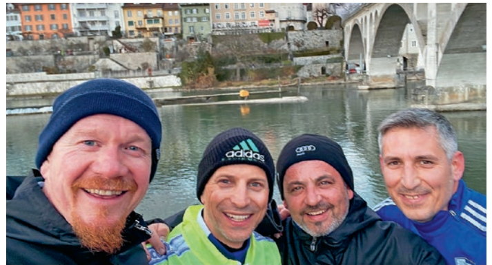
... Laufeinheiten in 2022 mit einer exklusiven Auswahl von Laufwilligen ...