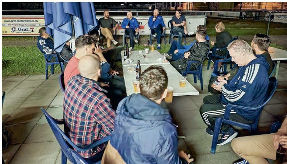
Bild der letzten Teambesprechung zur Festlegung der künftigen Mannschaftsmeldung 30+ oder 40+

Unser Altersdurchschnitt liegt bei 42,6 Jahren bzw. zwei Drittel der Mannschaft hat erst kürzlich oder bereits vor vielen Jahren das 40. Lebensjahr gebührend gefeiert. Somit drängte sich die Frage auf: In welcher Alterskategorie wollen wir im neuen Jahr auf Punktejagd gehen? Ebenfalls geprüft wurde eine Spielergemeinschaft mit benachbarten Vereinen. Um es kurz zu fassen: Damit wir als Team weiterhin zusammenbleiben und zusammen Fussball spielen können, werden wir erneut als 30+-Mannschaft in den Wettbewerb einsteigen. Vermutlich werden wir mit unserem Altersdurchschnitt nicht zu den Titelanwärtern gehören, da leider immer noch kein Titel für die beste Mannschaft der dritten Halbzeit vergeben wird. Als Team möchten wir aber unbedingt zusammenbleiben, und die unter 40-Jährigen haben unter Eid geschworen, künftig auch ein paar Meter für die über 40-Jährigen mitzulaufen. Das sollte also klappen.