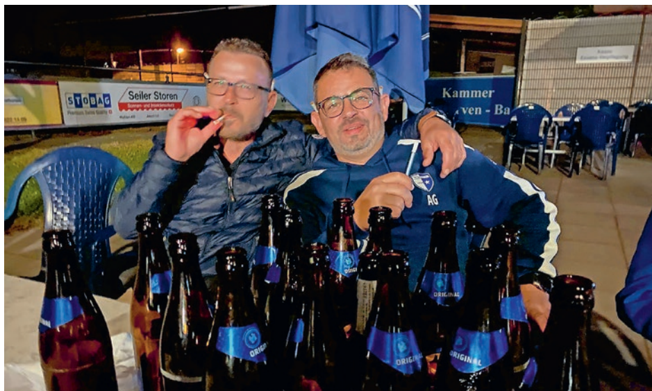
Gleicher Abend, zu etwas späterer Stunde

Der Sommer naht und um unsere Körper auf «Bikini-Figur-Niveau» zu bringen, trainieren wir weiterhin bis zu den Sommerferien unverändert am Dienstag um 19.30 Uhr auf dem Kunstrasen. Wer noch gerne zu den Senioren dazustossen möchte, ist herzlich willkommen.