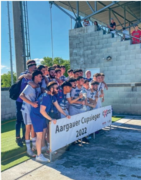
3. Mannschaft nach dem Gränichen-Spiel