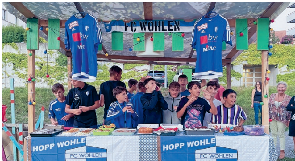
Kuchenstand der Junioren C2 an der Sommerbar in Wohlen.