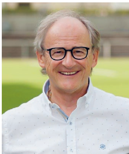
Geschätzter FC Wohlen