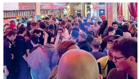
Die jubelnde Zuschauermenge, während wir unsere Fitnessübungen als Teil unseres öffentlichen Trainings absolvierten.