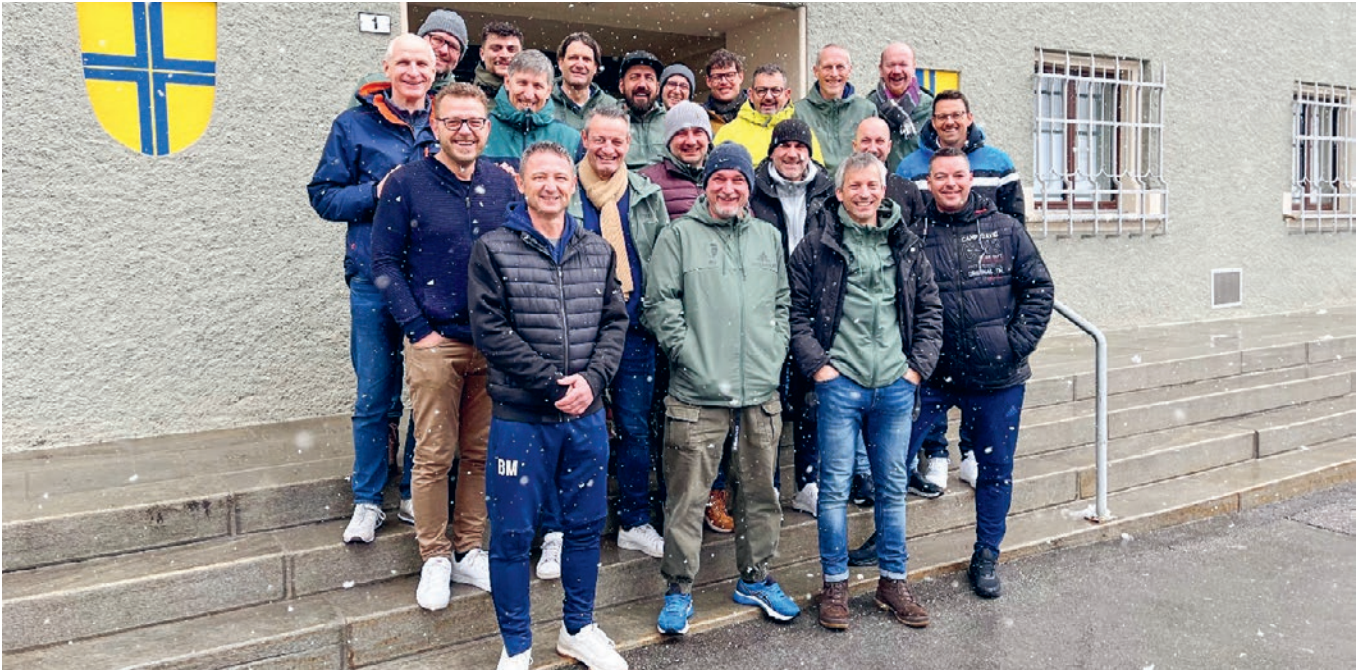
Gruppenbild am Tag der Abreise mit glücklichen, aber auch etwas müden Augen.

ZUM 10. MAL HABEN SICH DIE SENIOREN ZUR VORBEREITUNG AUF DIE RÜCKRUNDE IN DAVOS ZUM SOGENANTEN HÖHENTRAININGSLAGER GETROFFEN.